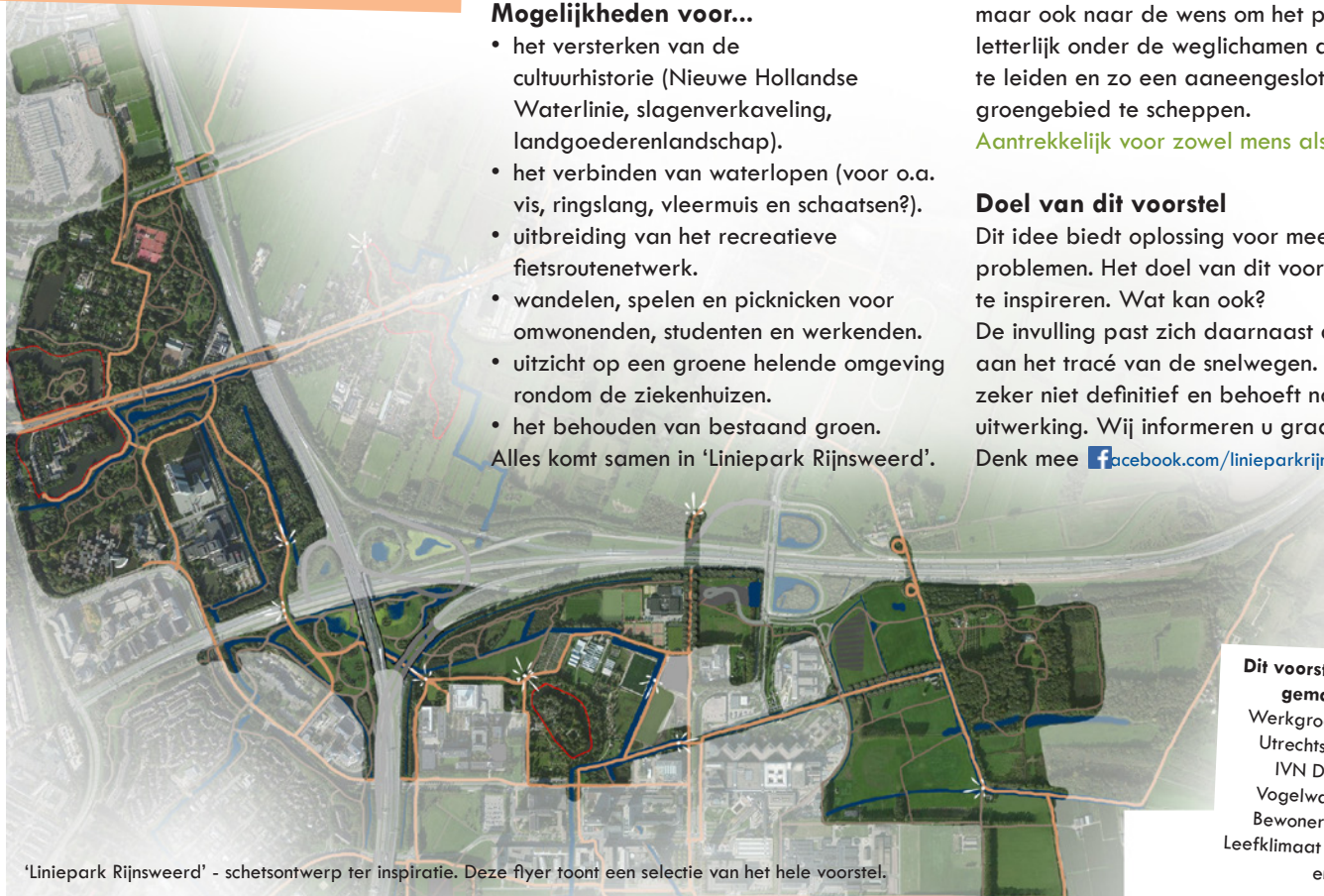
'Liniepark Rijsweerd' - schetsontwerp ter inspiratie. Deze flyer toont een selectie van het hele voorstel.

Denk mee facebook.com/linieparkrijsweerd