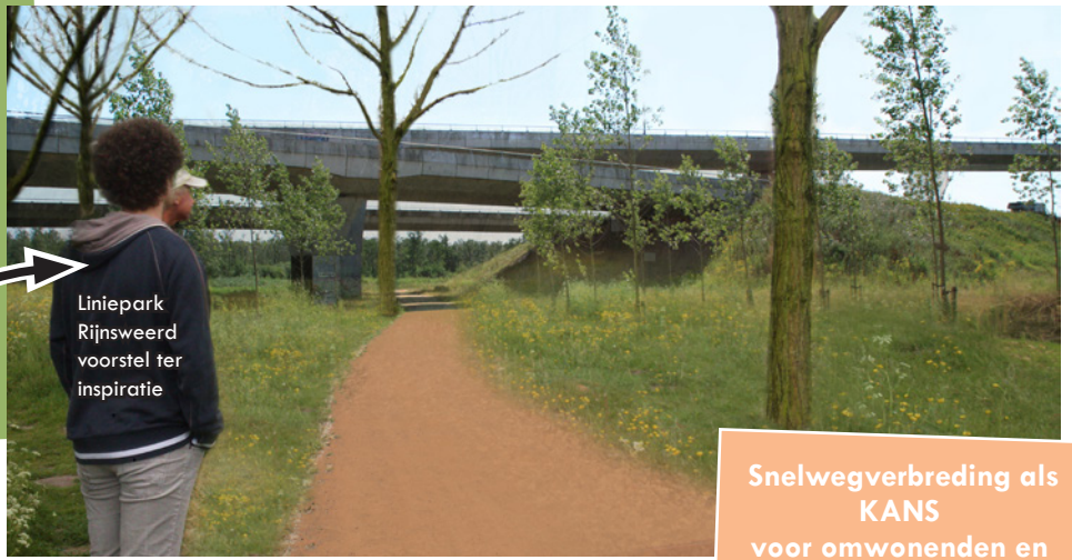
Liniepark Rijsweerd voorstel ter inspiratie

Snelwegverbreding als KANS voor omwonenden en recreanten